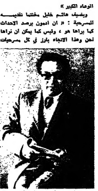
الاديب ادمون شماده

رغم ان صديقا الاديب ادمون شماده معروف كشاعر حيث الا ان ما اصدره خلال ثماني سنوات كان ثلاث مسرحيات وجوهرتان شعريتان يدعى « أبو الياس » بالجمهورية العربية الاولى « ظلام الوجوه » والماني « سنة 1977 نظما مسرحية برج الزواج ومسرحيات اخسرى سنة 1974 بعدها في سنة 1976 اصدر مجموعته الشعرية الثانية بعنوان « حين لم يسق سواك » ، مسرحيات ثلث هذه المجموعة الشعرية : « الصمت والزوال » سنة 1978 ومسرحية القديسة سنة 1978. وحول القديسة لا بد ان نذكر ان هذه المسرحية حازت على الجائزة الاولى في مسابقة المسرحية التي اقامها ونظمها المجلس الشعبي للاداب والقانون عام 1978 وحول المسرحية التي سبقها « الصمت والزوال » لا بد ان نذكر ان المسرحية انتوان صالح قديما في مسلسل سباعية على شاشة التلفزيون بعنوان الصنم .